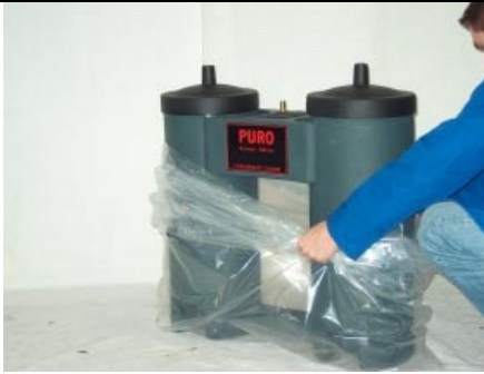
Packa ut modulen