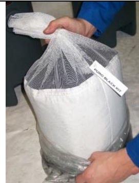
Packa ut kolelementet