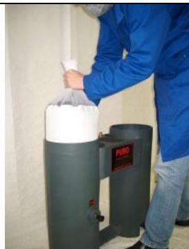
Sätt tillbaka kolelementet