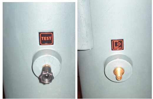
Skruva in TEST-ventilen och utloppsnyckel på de markerade platserna (se test- och utgångsdekalerna)