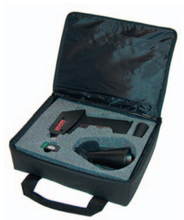
Provisto en un caso de todos los accesorios requeridos

La turbulencia genera un amplio espectro de sonido. Hay componentes ultrasónicos en onido y puesto que el ultrasonido será el más ruidoso por el sitio de la fuga, la detección de estas señales usar el LOCATOR® es generalmente absolutamente simple.