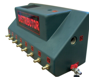
Salida y Válvula de mantenimiento