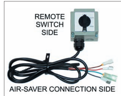
Llave externa Air-Saver 1" y 2"