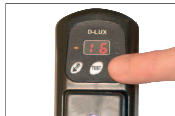
Micro switch testknop