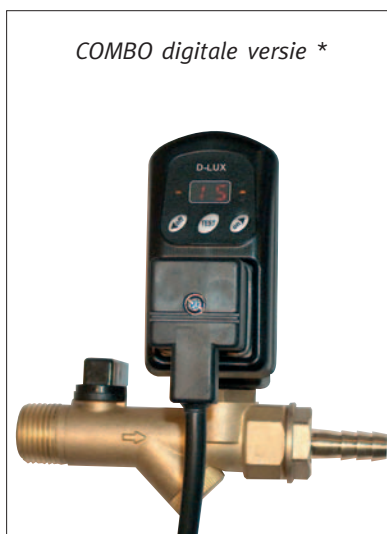
COMBO digitale versie *