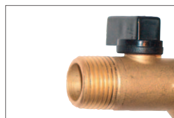
Kogelkraan met dubbele aansluitmaat (G1/2 / G1/4)