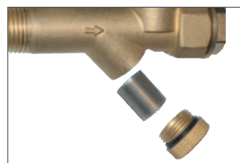
Kogelkraan met geïntegreerde vuilzeef