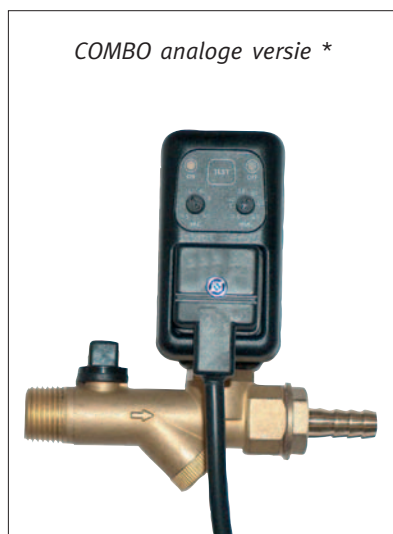
COMBO analoge versie *