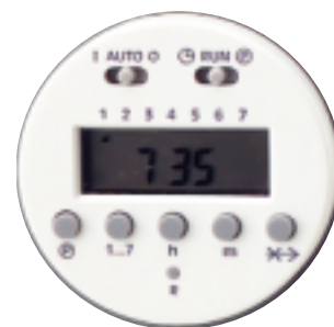
Programma & tijd-display