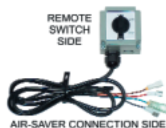
Externe schakelaar Air-Saver® G1 & G2