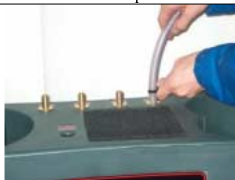
Connettere i tubi d'ingresso