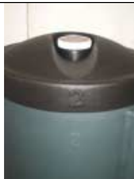
Riposizionare il coperchio numero 2 sulla torre numero 2

Inserire il kit di controllo per futuro riferimento