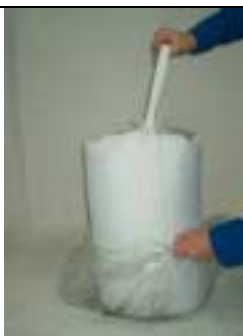
Togliere il filtro a carbone dal sacchetto