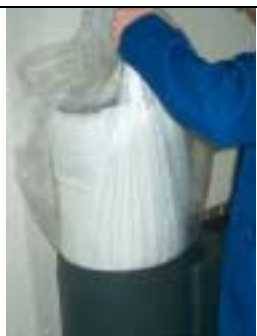
Rimuovere il filtro a carbone