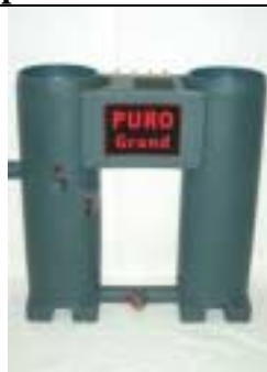
Rimuovere i coperchi