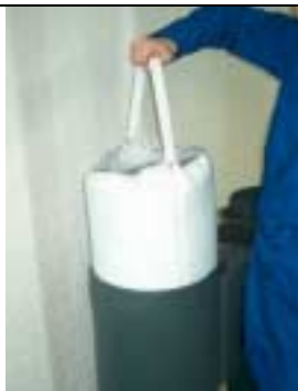
Rimettere il filtro a carbone