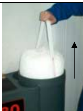
Rimuovere il filtro multiplo

Inserire il kit di controllo per futuro riferimento